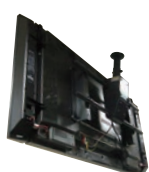
ディスプレイハンガー