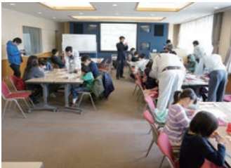
宍粟市で開催された「ものづくり Dr.KidsKey アカデミー」

オーエスグループの品質基準を満たした部品や Optoma や Vogel's といった、海外の優れた技術を持つ製品の輸入やオーエスブランド製品の輸出をしています。まさにオーエスグループの海外窓口の役割を担っています。