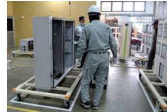
サイネージ筐体生産ライン

蓄積されたノウハウを生かし、取り扱い商品に限らず様々な分野のお客様の商品企画・設計に携わっています。特注対応におけるきめ細やかな対応のほか、改善改良、品質向上、信頼性評価といった面でもエンジニアが「チーム一丸」となってものづくりを行っています。