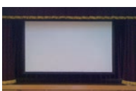
舞台装置 (大型スクリーン、バトン)