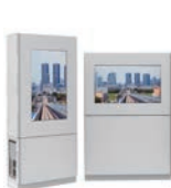
デジタルサイネージ筐体