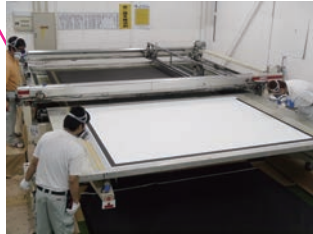
国内最大級のシルク印刷機

コア技術と最先端技術を融合させ新たな付加価値を生み出すことの出来る技術集団です。製品開発に必要な機械・機構・リレー回路・電子制御回路・部品など各種設計、ICプログラム、映写生地素材開発、製品化技術など多岐に渡った技術とノウハウを持ち、そのすべてを内製化しています。