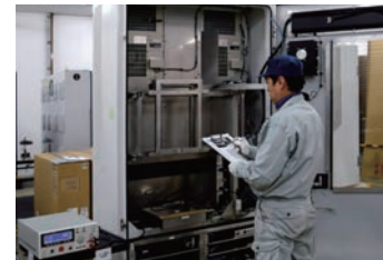
検査員による厳正な検査