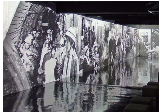
博物館に納入したLEDプロジェクター20台を使った長さ30mの巨大映像プレゼンティング