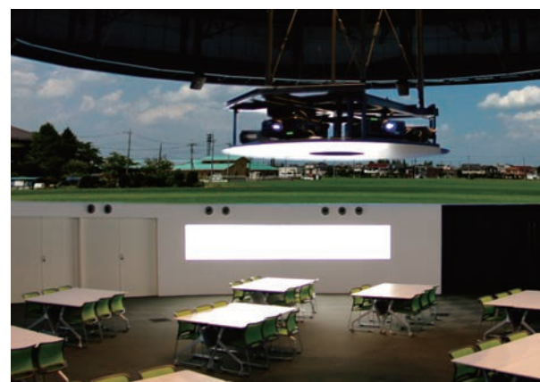
大学に設置した360°の連続した画面投写