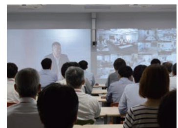
全国の拠点をつなぐテレビ会議システムを導入