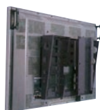
ICTのベストセラーディスプレイハンガー TH200・400・600