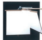
カスタムスクリーン壁付