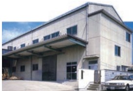
1979年オーエス工業枚方工場