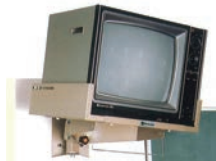
テレビハンガー開発