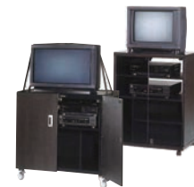
AVキャビネットの取り組みはCRT用のAVテーブルからスタート